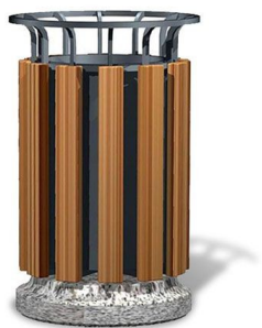
Урна металлическая с деревянным декором