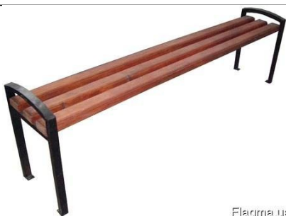
Flagma.ua Скамья без спинки