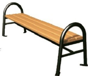
Скамья без спинки