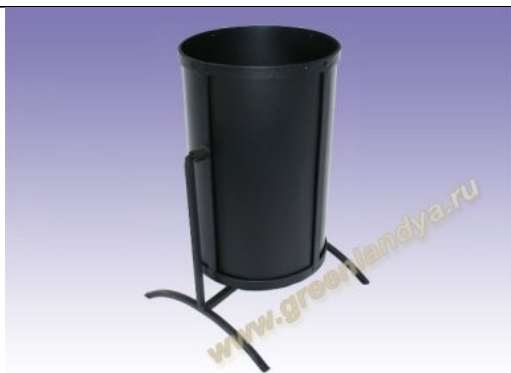
Урна для мусора