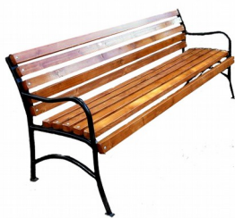
Скамья со спинкой