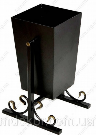
Урна для мусора